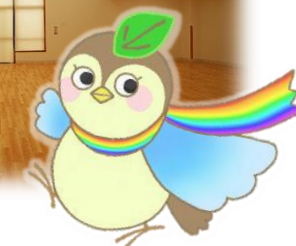
マスコットキャラクター エールちゃん

英語の「エール (yell)」には、「声援」や「励まし」の意味があります。がんばる子どもたちやご家族を、全力で応援するセンターを目指します。また、フランス語の「エール (aile)」には、「翼」という意味があります。子どもたちがそれぞれの色に光輝き、未来に羽ばたく姿をイメージしています。