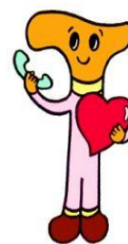
はなしてなごむ君